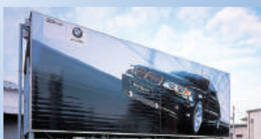
※用途例のイメージ写真です。